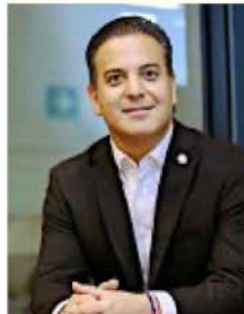
■ Damián Zepeda, senador panista.

También indicó que apoyaría que Xóchitl Gálvez buscara la dirigencia del PAN.