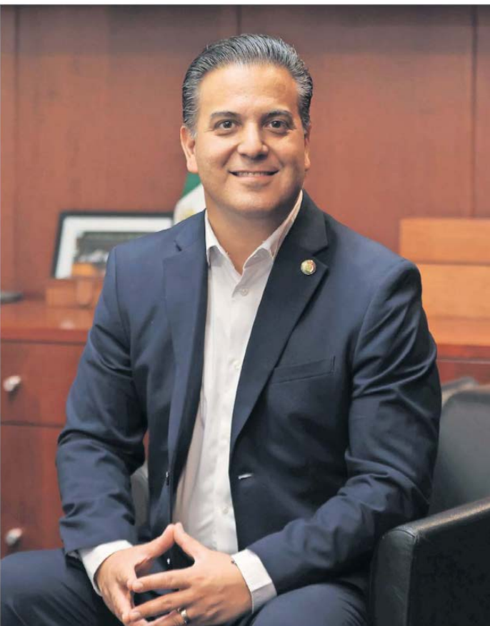
BERENICE FREGOSO, EL UNIVERSAL

Senador del PAN y aspirante a la dirigencia nacional del partido