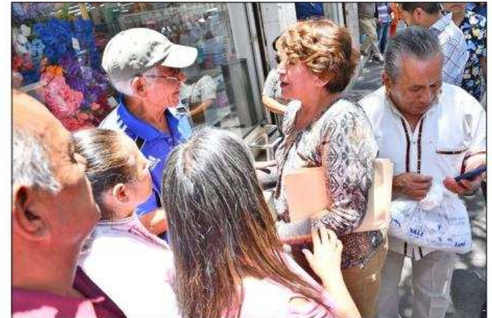
▲ La gobernadora, que en la foto saluda a toluqueños en la calle, se reunió con militantes de su partido, en Metepec. Foto especial

Sin embargo, en dicho encuentro no dejó de decirles que, tras el momento de felicidad, algarabía y festejo, vendrán tiempos de responder a la confianza excesiva de la gente que, con una esperanza desmedida,