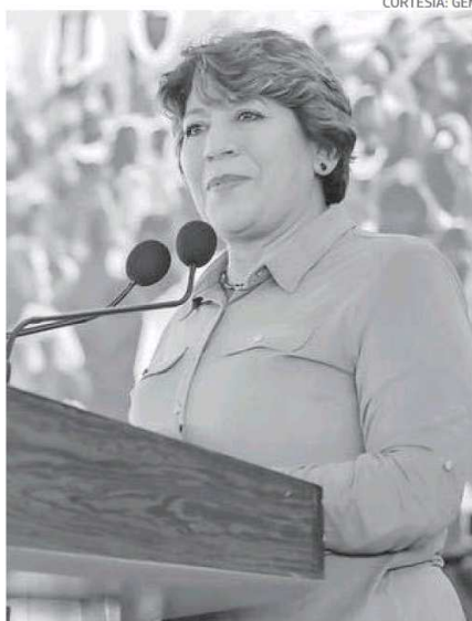
Señalaron que la coalición podría aumentar el número de integrantes en el grupo parlamentario

Legisladores y ediles confirmaron que la reunión se llevó a cabo en Metepec, en las instalaciones de la Secretaría de Medio Ambiente el martes por la tarde, donde entre otras cosas, destacaron que el Estado de México aportó más de