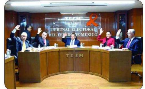
Teoloyucan, Teotihuacán, Tezoyuca, Valle de Bravo y Villa del Carbón.

Quienes tienen más de uno son Almoloya del Río , Atizapán , Coacalco , Coatepec Harinas , Cocotitlán , Ecatepec , Hueypoxtla , Huixquilucan , Ixtlahuaca , Jilotzingo , Metepec , Naucalpan , Nezahualcóyotl , Nopaltepec , Ocoyoacac , Rayón , San Antonio la Isla , San Mateo Atenco , Tecámac , Tenango del Aire ,