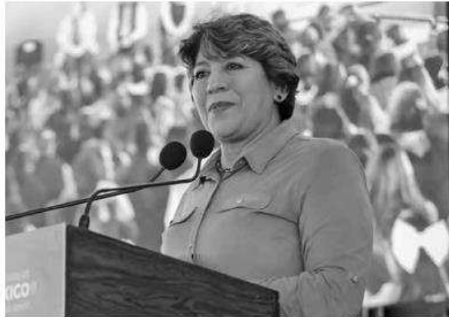
Gobernadora Delfina Gómez

En entrevista, el presidente municipal electo de Naucalpan y actual diputa-